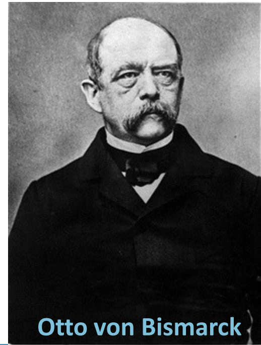
Otto von Bismarck