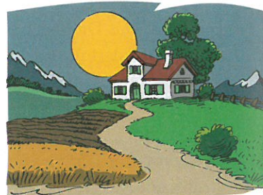
Wir wohnen auf dem Land – ganz am Rand.