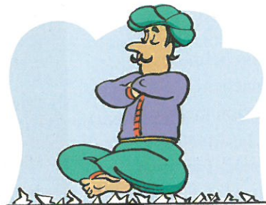
Der Fakir sitzt auf Glas, nicht auf Gras.