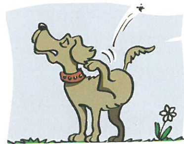
Der Hund ist froh – ohne Floh.