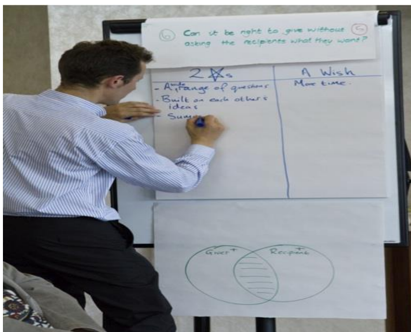
Hodnocení: 2 hvězdičky (2 dobré věci) a přání (co by se dalo dělat lépe)

Ohlédnutí za procesem: Hodnocení toho, jak celé setkání zkoumajícího společenství probíhalo, je potřeba věnovat dostatek času. Použít přitom můžete například následující otázky: Jak nám to šlo? Bylo to dobré zkoumání? Vybrali jsme dobrou otázku? Jakým směrem chceme pokračovat? Co bychom měli podrobněji studovat a co je třeba probrat důkladněji? Co hodláme podniknout?