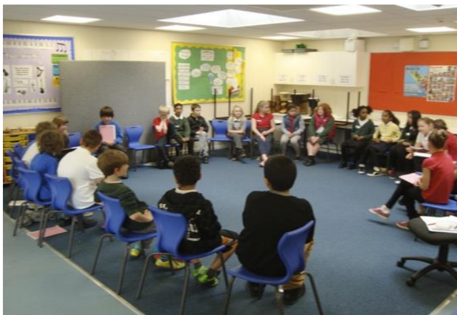
Zkoumající společenství v rámci filozofie pro děti

Pro učitele je klíčovým úkolem vytvořit takové učební prostředí, ve kterém se žáci nebojí říci, co opravdu cítí. Když učitel položí otevřenou otázku, odpovědi žáků mu napoví, kde se právě nacházejí jejich myšlenky. Je pak učitelovým úkolem vznést takové otázky, které povedou k hlubšímu zamyšlení nebo studenty nasměrují jinam. Učitelova schopnost rozvíjet a utvářet dialog je zásadní. V ideálním případě se studenti potřebují naučit, jak vést podobně bohatý dialog mezi sebou, když pracují ve skupinách. Alexander (2010) popisuje, jaký má na děti dopad, když vidí, že jeden z jejich vrstevníků má zcela odlišný pohled – může to vést k přehodnocení jejich vlastního pohledu na svět a podpořit jejich kognitivní rozvoj. Čím rozmanitější jsou pohledy ve skupině, tím větší jsou možnosti rozvoje kognitivních schopností a sociálních dovedností.