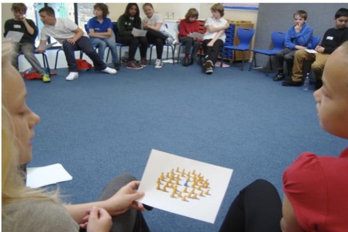
Žáci si vyměňují myšlenky ohledně podnětu.

Čas k zamyšlení: Poté, co se zúčastnění seznámili s podnětem, by jim měl učitel ponechat čas na samostatné přemýšlení. Jelikož v mnoha třídách studenti přemýšlejí jen pár sekund a ihned začínají klást otázky, zatímco cílem je povzbudit zúčastněné k hlubšímu zamyšlení a k reflexi, může jim učitel dát (a odměřit) jednu minutu. Může také studenty požádat o klíčová slova, nápady či myšlenky. Ty lze jednotlivě či ve dvojici zapisovat nebo je přednést před celou skupinou, přičemž je zapisuje učitel nebo pověřená osoba. Učitel může zaměřit pozornost na pojmy, které jsou nejasné, a ujistit se, že je všichni zúčastnění chápou stejně.