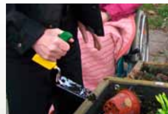
Dobře padne do ruky – ergonomická lopatka

Tip: ve foyer informuje působivě zpracovaná vývěska o pravidelných nabídkách zahrady a o příslušných odpovědných kontaktních osobách.