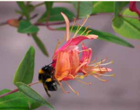
Návštěva v zahradě, kterou každý rád vidí ...