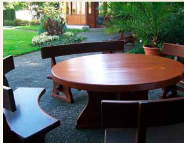
Společně u stolu – perfektní i pro vozíčkáře