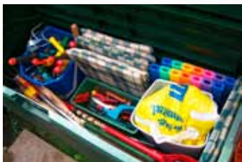
Zahradní truhla s nářadím umožňuje kdykoliv se obsloužit

(poznámky autorky z ergoterapeutické činnosti)