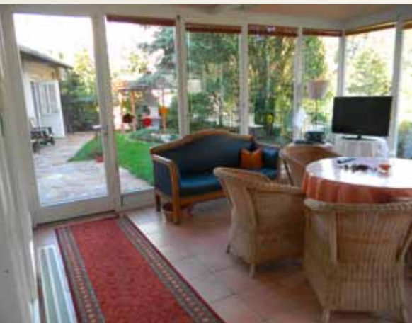
Uvnitř – venku, Pečovatelství ústav spolkové země Salzburg