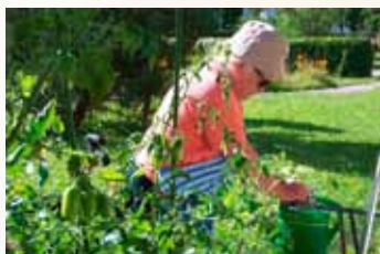
Zakousnout se do úkolu