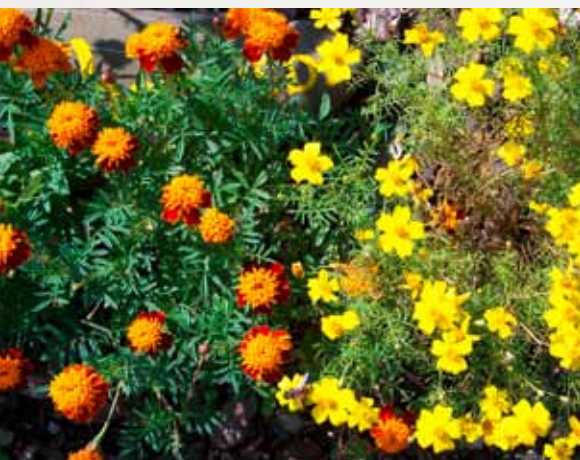
Aksamitník – milují ho i šneci