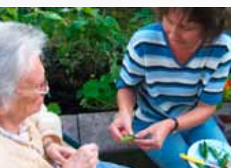
Intenzivní práce s detailem: čerstvý hrášek z lusku