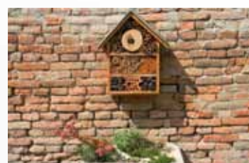
Nabídnout hmyzu místo pro život: pomoc při hnízdění

Druh, vlastnosti, nároky, původ a použití rostlin je nevyčerpatelné téma: spolehlivé a tradiční rostliny, ozdobné rostliny, bylinky, léčivky, zelenina, ovoce, vonící rostliny, aromatické rostliny, rostliny pro motýly, jednoleté a dvouleté rostliny.