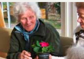
Vlastní rukou: dávat a brát

Pro lidi s onemocněním demencí je těžké ignorovat odchytky, jako např. rozhovory ostatních. Při pravidelných, pomalu probíhajících návštěvách se může přizpůsobit senzorická stimulace na kognitivní schopnosti a zájmy obyvatele. Abychom vytvořili rutinu a důvěru, je rozhodující čas, který máme k dispozici.