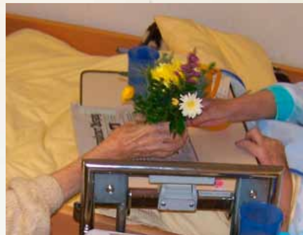
Setkávání se - laskavá pozornost - všímání si

Pravidelné návštěvy na pokojích umožňují vybudování trvalého vztahu a doprovázení v rozličných fázích a odděleních institucionálního života. Můžete dát podnět k další účasti na terapeutických aktivitách v rámci zahrady – tyto činnosti jsou možné, i když se tělesný a mentální stav obyvatele zhoršuje.