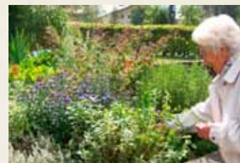
Pohodná sklizeň léčivek ve stoje