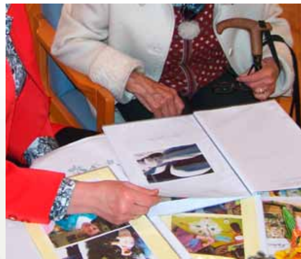
Zachyceno objektivem: zahrada, situace a lidé. Dojmy a pozitivní emoce mohou být reprodukovány při společném pozorování

Doprovodné fotografie jsou dobrou možností, jak opětovně v paměti vyvolat situace, vývoj a s ním spojené smyslové zkušenosti (s písemným souhlasem zobrazených osob nebo jejich zástupce) a jak terapeutickou nabídku v rámci zahrady interně i externě publikovat.