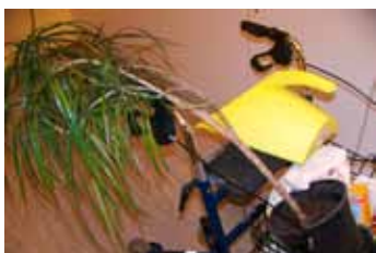
Starat se o živé – stát se pečovatelem

Všechny cesty ve stacionárním úseku nebo v oblasti bydlení mohou být zkráceny – ale je nutno vést smysluplná setkávání. Snadněji se to provádí s „pojízdnou zahrádkou“ nebo vozem na materiál, naloženým konvemi na zalévání, rostlinami, kbelíky, lopatkami, časopisy a odbornou literaturou. Pro cesty do pokojů obyvatel je nutno pokud možno naplánovat čas: pozdravy, mezizastávky, nechat se oslovit, oslovit někoho, vyvolat zvědavost a reagovat na ni.