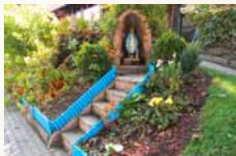
Pečovatelský ústav spolkové země Salzburg