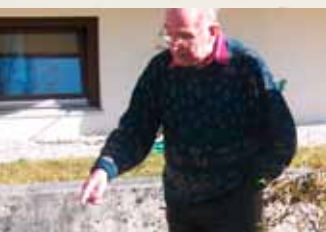
Klienti provází zájemce z řad návštěvníků

ploty, zdi a živé ploty. U laťkových plotů táhnout diagonálně, popřípadě horizontálně laťky na vnější straně, abychom zabránili přeledení. Výška: normativ 160cm. Branky nebudou opticky odlišeny od plotu, budou zřejmě zakryty zasazením keřů, cesty k nim nepovedou (pravděpodobně). Alternativou může být elektronický bezpečnostní systém, který bude hlásit opuštění definovaného prostoru.