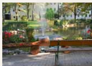
Místo pro odpočinek s výhledem (Domov seniorů Hellbrunn, Salzburg)