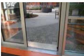
Bezbariérový přístup (Maimonides centrum, Vídeň)

Zahrada by měla být volně přístupná i bez doprovodu, otevřená potřebám pohybu právě v rámci dobrého tělesného stavu. Výzvou pro detailně níže popsaná upozornění týkající se jejího uspořádání by měla být podle omezující časové a prostorové orientační schopnosti nebo nejistoty při průběhu pohyblivosti. Obyvatelé sunou nohy za sebou po zemi, mají potíže udržet rovnováhu nebo ujít delší vzdálenosti. Zátěže vycházející z okolí, jako např. hluk a prostorová stísněnost, nemohou být kompenzovány. Stimulace bez stresu, pomoc při vnímání a orientaci, autonomie a kontrola a možnost volby mezi soukromím a společností jsou dimenze, které nesou u lidí s demencí při uspořádání zahrady velký význam (Heeg, Bäuerle 2004).