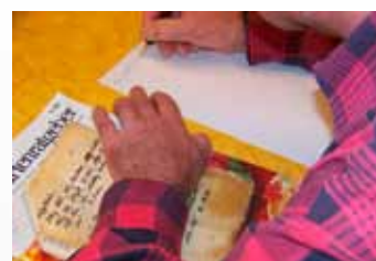
Logické spojení: zahrada a vyzkoušené recepty