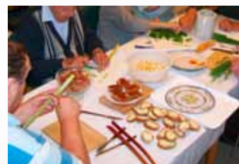
Díky známé práci a prožitku ožívají vzpomínky