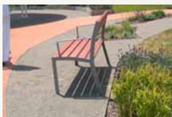
Cesta „vede“ zahradou (Dům milosrdenství, Vídeň)