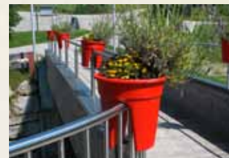
Životní pomoc Bad Aussee, Oase