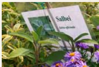
Podělit se s návštěvníky o informace