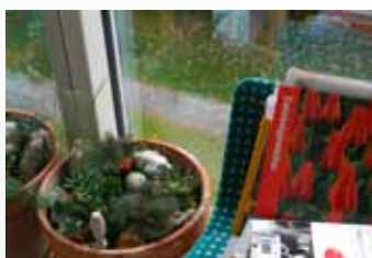
vytváření vlastního okolí