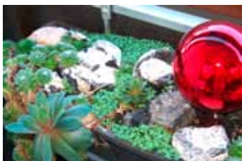
Snadná péče a dlouho vydrží

(poznámky autorky z ergoterapeutické činnosti)