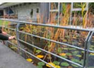
Rybník – na pohledu zevnitř a zvenčí, Dům seniorů Bad Hofgastein