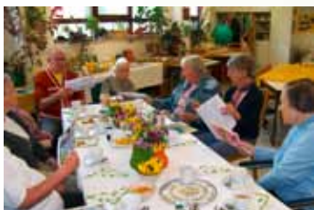
Zahrada v centru společných úvah