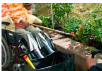
Lehký nástroj, který je možné plynule prodloužit pro lehkou práci z kolečkového křesla