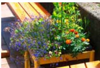
Pozorovat vsedě květy a jejich návštěvníky

Kontraindikace jsou alergie, otevřené rány, akutní infekce, akutní záchvat zánětlivého revmatického onemocnění nebo aktivovaný, artritický kloub, umělé vývody: dýchání, stravování, odvod moči (břišní stěna) a silné závratě (podle Berting – Hüneke, 2007/10).