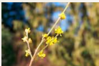
Brzký květe: Cornus mas (dřín obecný)