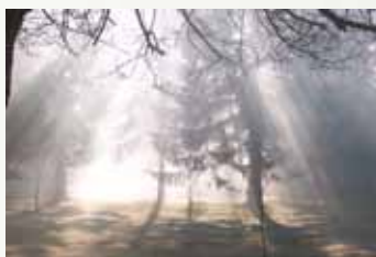
Nálady v parku – zachyceno objektivem