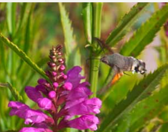
...a očekává, až konečně vykvete řetězovka viržinská: dlouhozobka svízelová

Naše řeč je plná rčení, která jsou převzata z přírody: „co zaseješ, to také sklidiš“, „být silný jako dub“, „být silný jako strom“, „květnatá řeč“, „mít pevnou půdu pod nohama“ a „kopřivu mráz nespálí“. Abychom mohli terapeuticky porozumět vzájemnému působení člověka a přírody, je třeba sledovat stálé životně důležité spojení člověka a rostlin. „Vyjádřit něco květinou“, „vyrůst z toho nejhoršího a uzrát“, „zapustit kořeny“ nebo „být vykořeněný“ ..., mohli bychom zmínit ještě další a další příklady a obvyklé obrazy a pojmy. Jen v kolika pohádkách, příbězích a písních hrají květiny, bylinky a stromy svou roli!