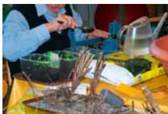
Příprava jara v domě