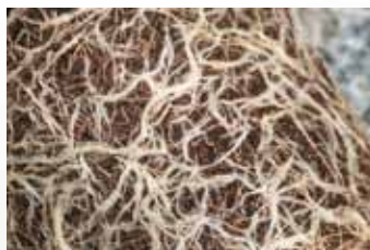
Zakořenit se ...