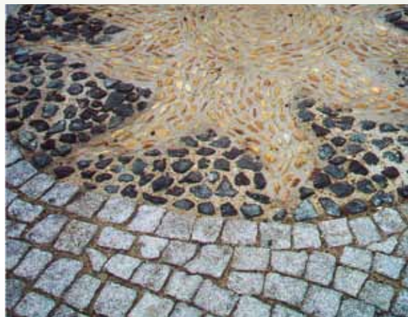
Ornamenty v zámkové dlažbě jako pomůcka pro orientaci