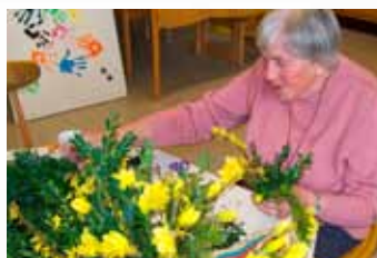
Vybrat si z mnoha možností