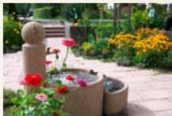
Centrum seniorů Insula, Bavorsko