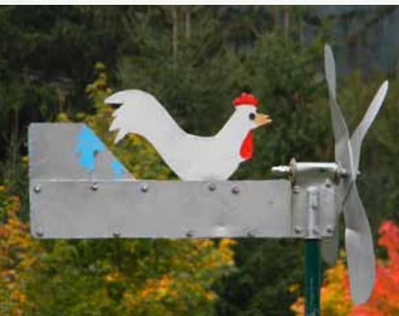
Toto postavil klient – pro všechny! Dům seniorů Bad Hofgastein, Salzburg