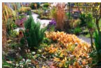
Zlatý podzim, Centrum seniorů Insula, Bavorsko