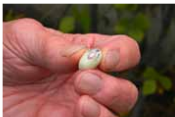
Fazol zahradní ( Phaseolus vulgaris ) se zvláštní kresbou