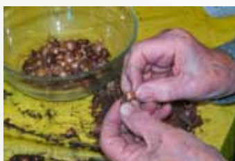
čištění cibulek čtyřlístku