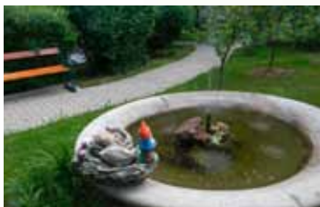
Domov seniorů Hellbrunn, Salzburg