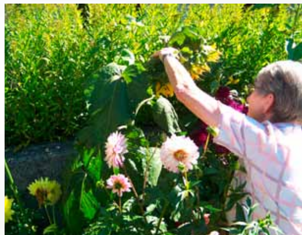
Zahrada nabízí důvod k pohybu a cíle, podněty pro všechny smysly