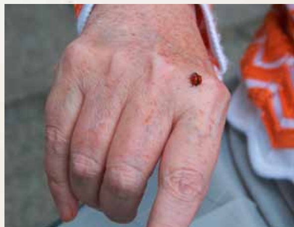
Intenzivní momenty - neplánovaný dárek: sluněčko sedmítečné