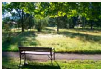
Nacházet na cestičkách místa na zahradě