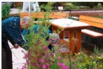
Sezóna v zahradě nekončí s prvním sněhem