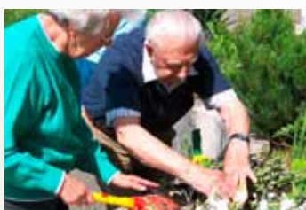
Ležící nástroj umožní spontánní spolupráci