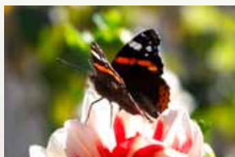
Oblíbený motiv z pohlednic