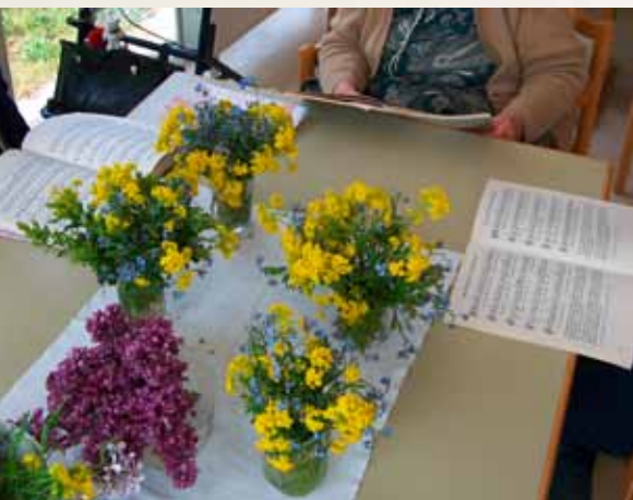
Jaro na vlastní kůži – s květinami a písněmi