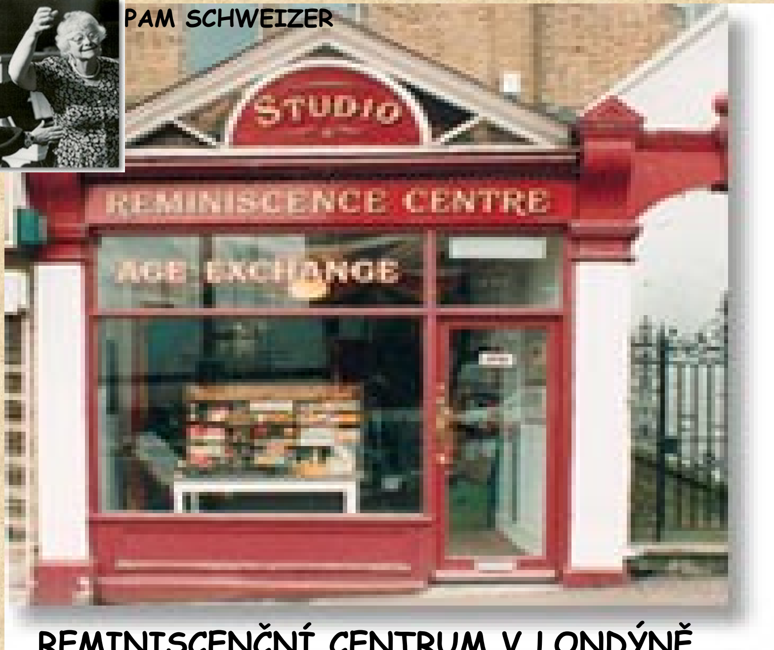
REMINISCENČNÍ CENTRUM V LONDÝNĚ