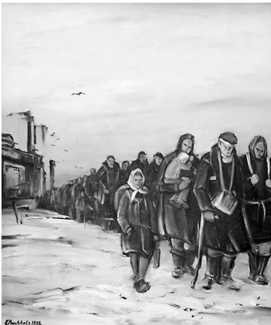
Eckhard Buchholz: Vertreibung (Vyhánění, 1992)

Sudetští Němci jsou podrobeni nelidské perzekuci bez ohledu na vinu. 19.5. 1945 je vydán Dekret presidenta republiky o neplatnosti některých majetkově-právních jednání z doby nesvobody a o národní správě majetkových hodnot Němců, Maďarů, zrádců a kolaborantů a některých organizací a ústavů . Jednotlivé oblasti pohraničí přebírají s tichou podporou státu od sovětské vojenské správy Rudé gardy (RG) zřízené Ústřední radou odborů na konci války.