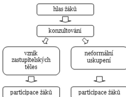
Obr. č. 1. Model „participace zdola“

Graficky je možné ve zjednodušeném modelu oba směry zobrazit takto: