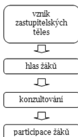
Obr. č. 2. Model „participace shora“