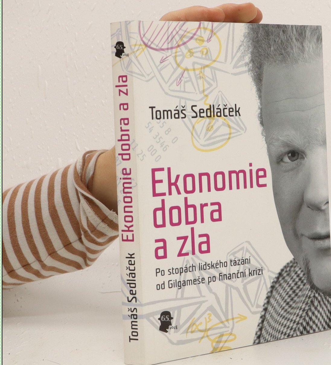
Křesťanská sociální etika. M. Martinek. Jabok 2022