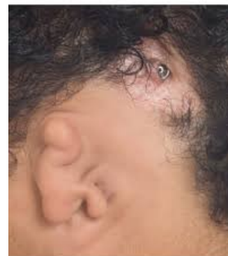
Fig. 2. Baha device components of the Baha system