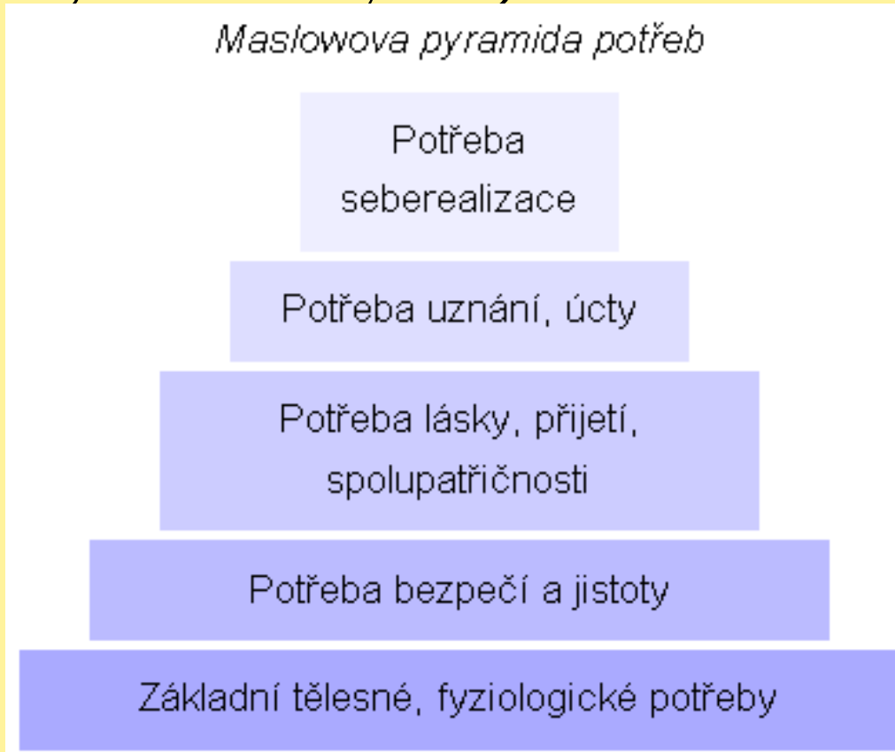
Maslowova pyramida potřeb