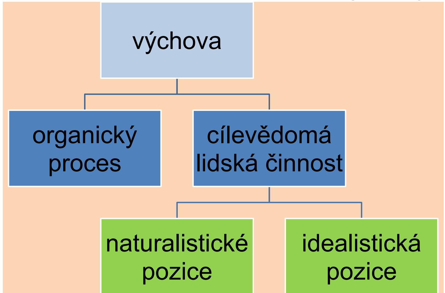
Schéma dosavadních teorií výchovy