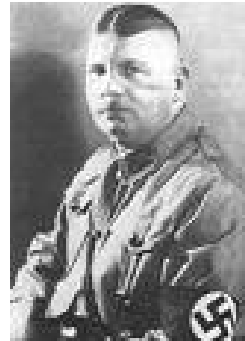
Ernest Röhm náčelník štábu SA