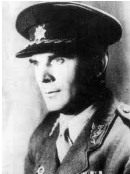
Generál Heliodor Píka odsouzen a popraven 1949