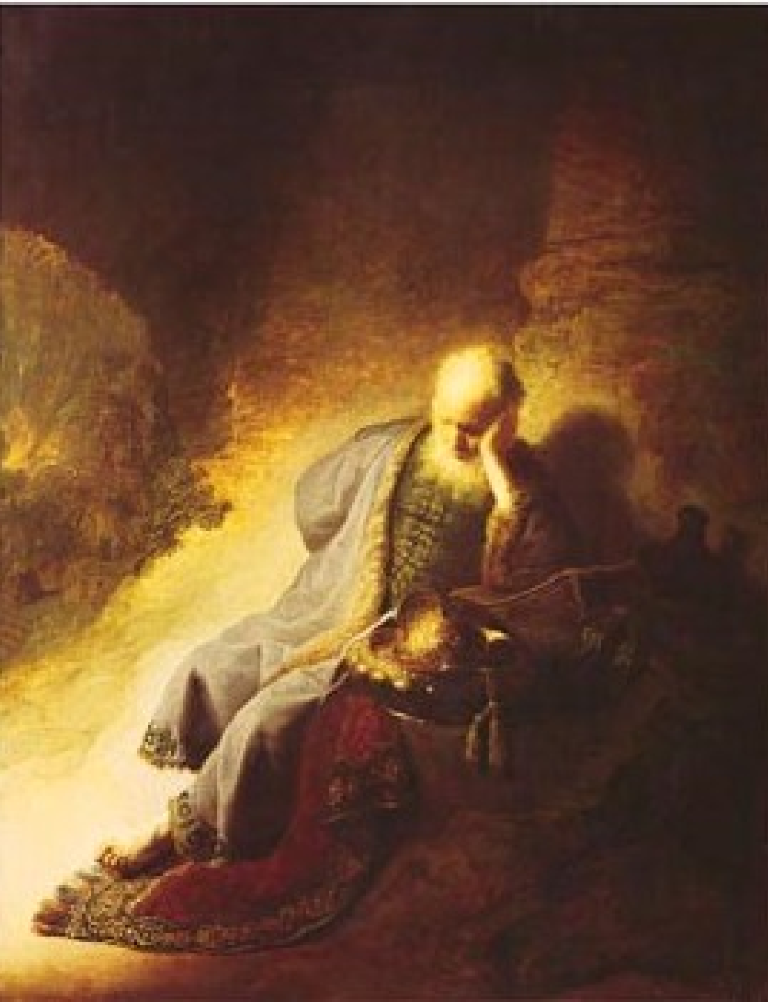
Rembrandt, Prorok Jeremjáš, 1630