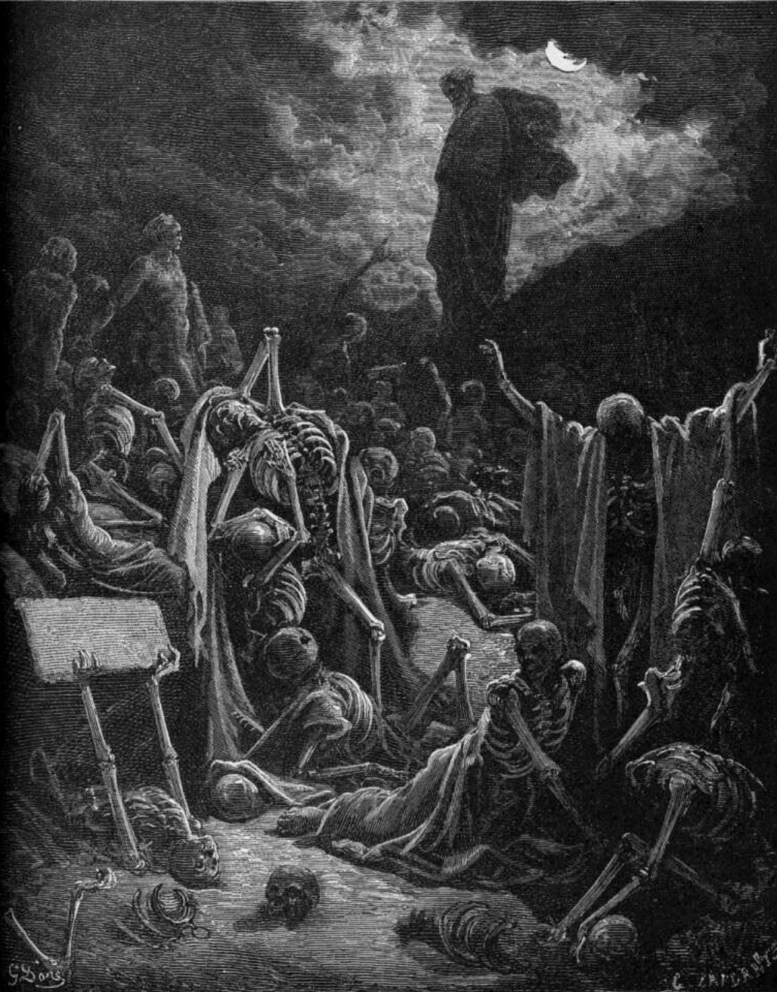
Gustav Doré, Prorok Ezechiel, Ez 37: Údolí suchých kostí