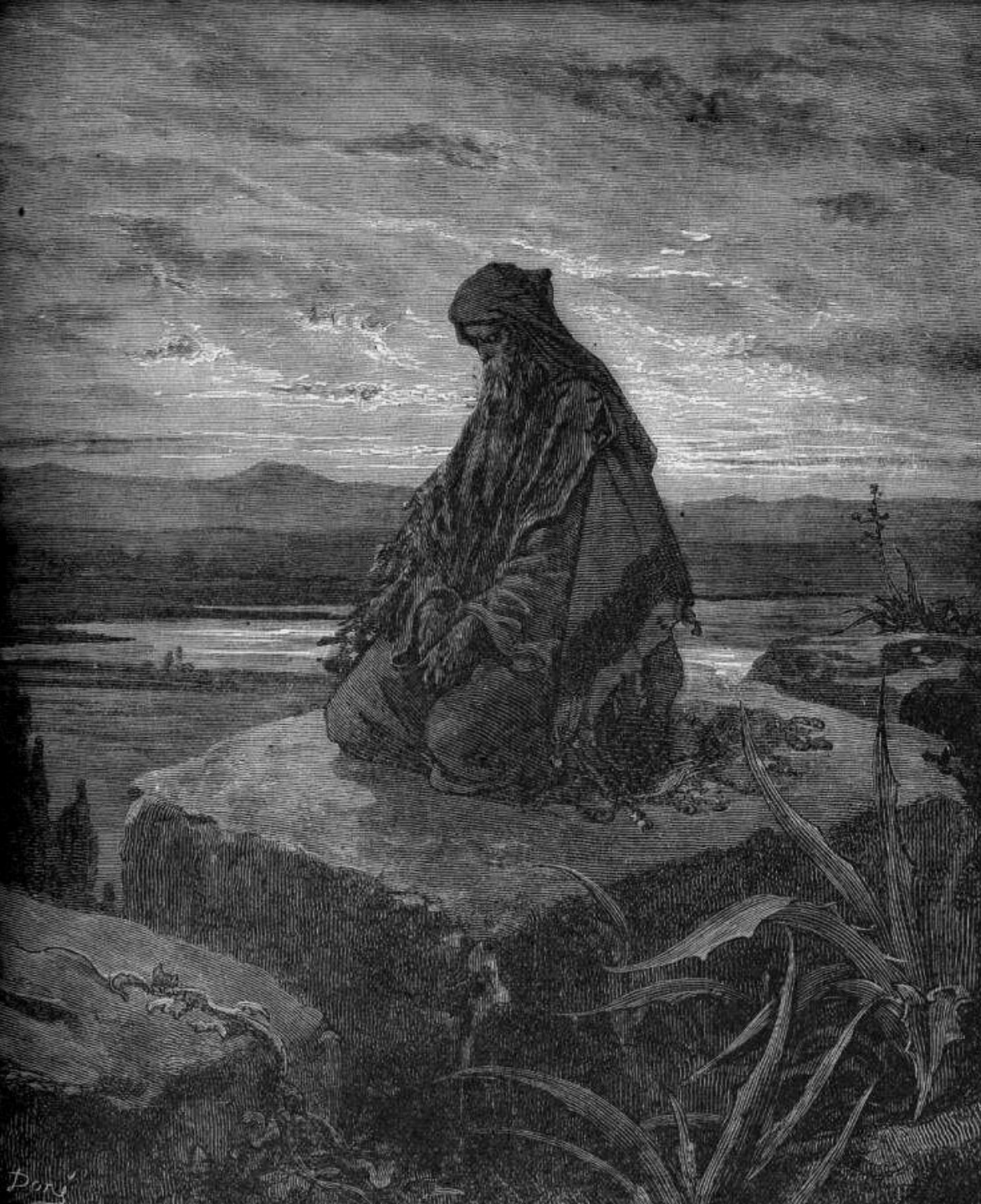
Gustav Doré, Prorok Izajáš