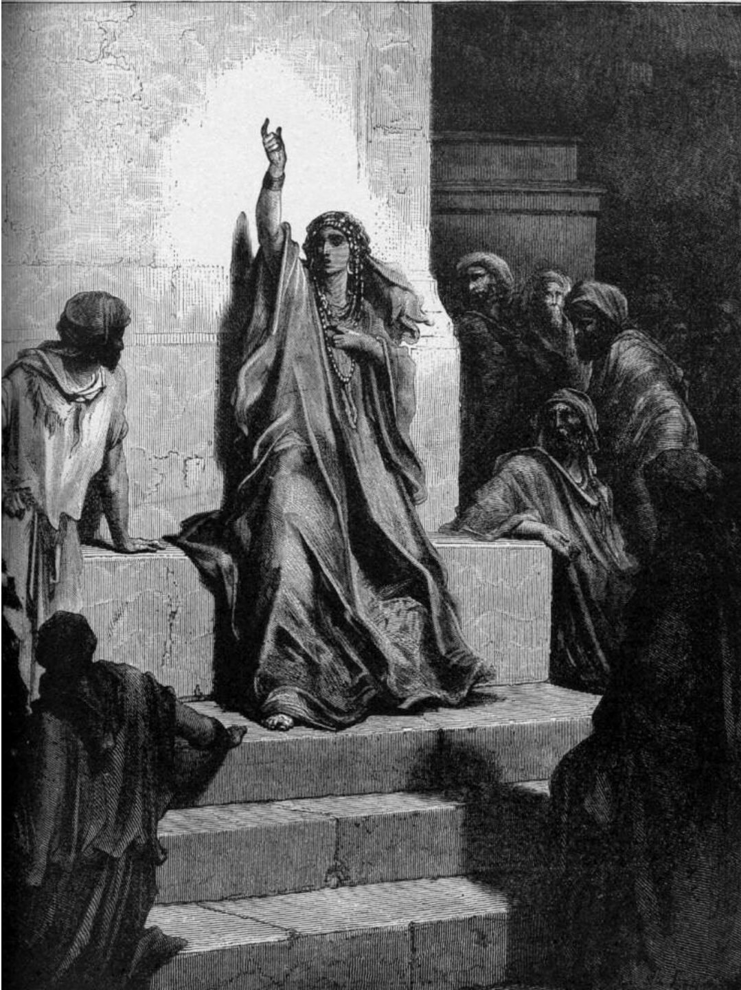
Gustav Doré, Prorokyně Debora, Debořina píseň