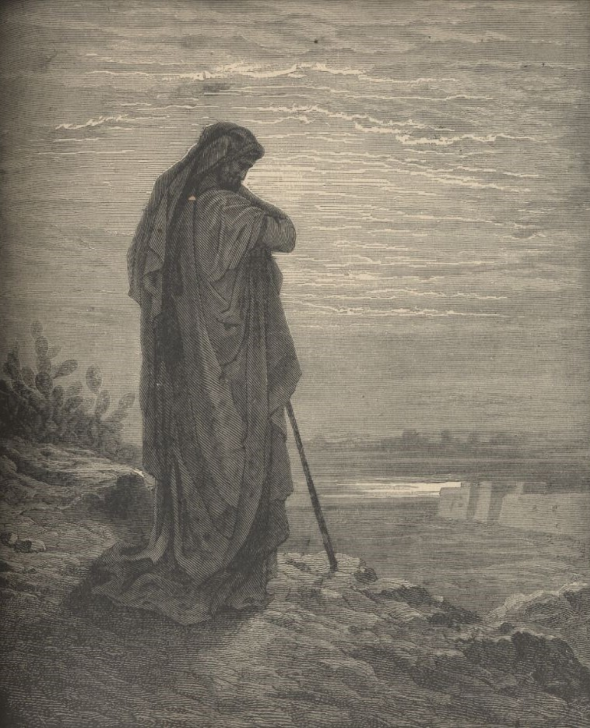
Gustav Doré, Prorok Ámos