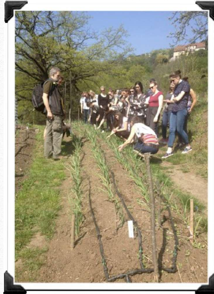
Komunitní zahrada Kuchyňka, studenti a učitelé SKE FHS UK