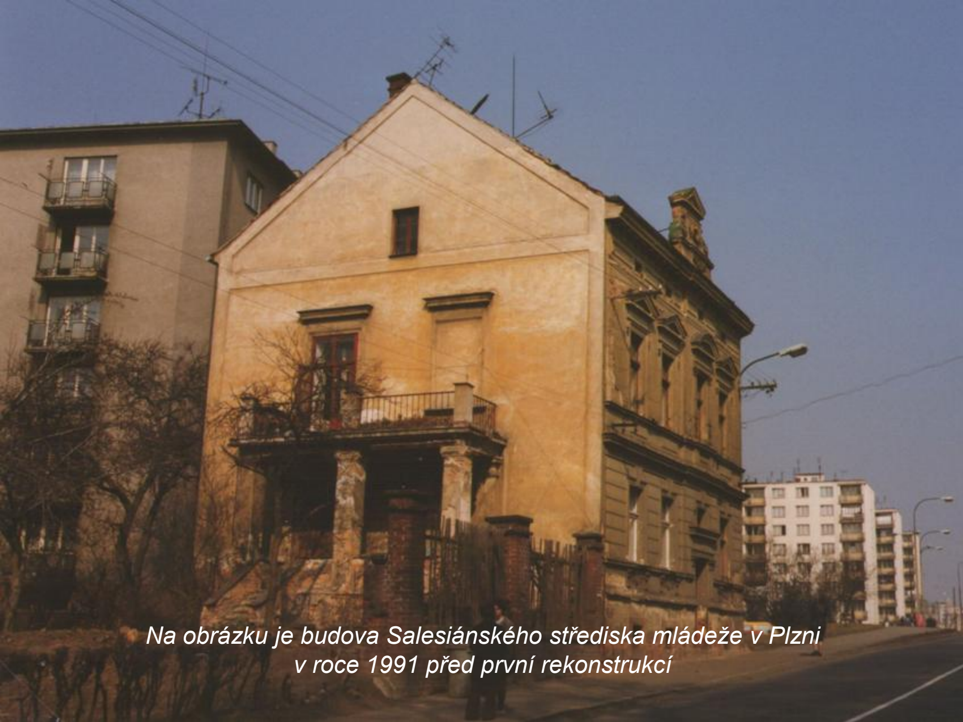
Na obrázku je budova Salesiánského střediska mládeže v Plzni v roce 1991 před první rekonstrukcí